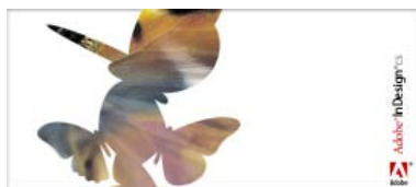
InDesign CS 启动画面