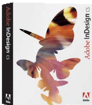
英文原版也称为国际版

欢迎使用 InDesign——未来创建图像密集型文档的专业出版解决方案。InDesign 是功能极为强大的设计和制作工具，它不仅能够提供无与伦比的准确性与控制功能，还可以与 Adobe 公司的专业图像处理程序无缝集成，这些图像处理程序包括 Photoshop 与 Illustrator。如果有特殊需要，用户可以通过使用 Adobe 或其他供应商的插件来增强或定制 InDesign 的几乎任何部分。在彩色印刷方面，InDesign 能够产生专业级质量的全彩输出。InDesign 支持多种输出设备和格式，例如：标准的 PostScript 文件、PDF 文件和 HTML 文件。评价一个软件的优良，有很多方面。最重要的是看是否能在同等的条件下，以最