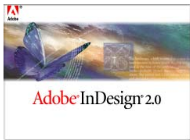
InDesign 2.0 启动画面