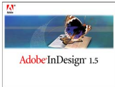
InDesign 1.5 启动画面