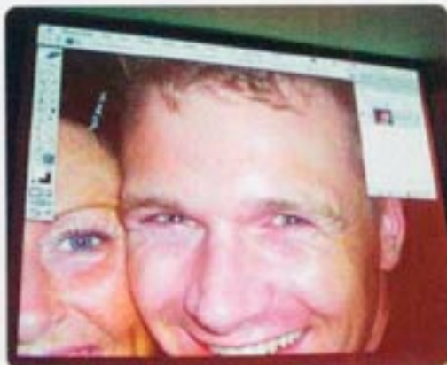
拿自己整容的现场展示